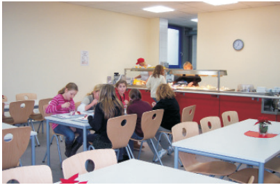
Mittagessen in der Mensa